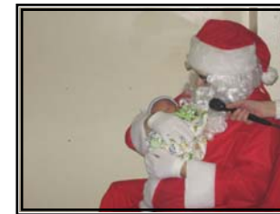
Le Père-Noël en compagnie de notre plus jeune invité de la soirée.